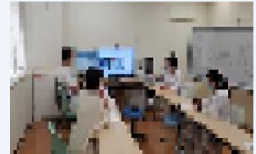
健康長寿医療センターが相談を受けている様子 (WEB会議)

町村の初期集中支援チームからの依頼に基づき、認知症支援推進センターの専門医とPSW等からなるチームが、チーム員会議に参加。会議では、事例検討等を通じてスーパーバイズとディスカッションを実施。