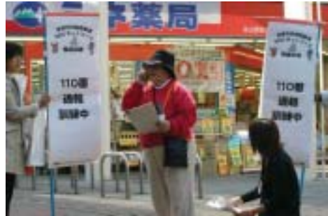
捜索要請の110番通報を行う家族役の地域委員