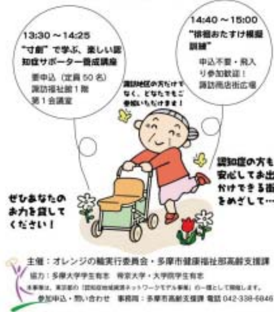
→サポーター養成の座学