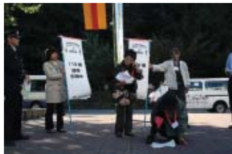
けが人（認知症の方）の救護を要請する119番通報を行う通行人役の地域委員