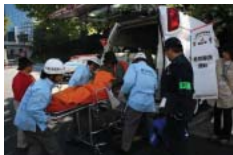
警察と消防が連携して情報を照合。救急搬送。