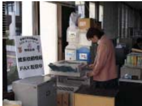
警察からの情報をFAXする高齢支援課職員