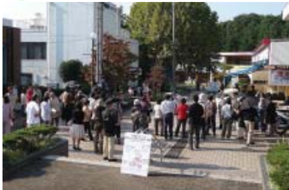
→実行委員の皆さん （地域委員+老人会等住民有志+介護者の会） 大学生も事前準備や当日に協力。