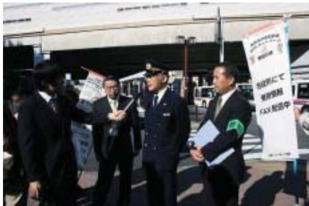
訓練後にMXTVのインタビューを受けた (右から順に警察、消防、多摩市高齢支援課)

10月4日のチラシと同じキャラクター（認知症の本人をイメージ）を、警察（ピーポくん）と消防（キュータくん）が支えるイメージを表現したポスター