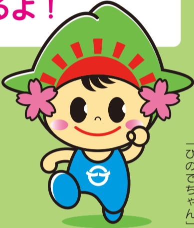
日の出町イメージキャラクター 「ひのでちゃん」