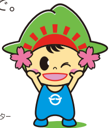
日の出町イメージキャラクター 「ひのでちゃん」