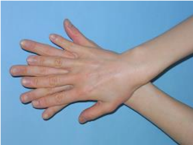
⑥ 親指を包み込むように擦る