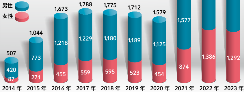
都内の梅毒患者報告数の推移(件)

2023年も都の梅毒患者報告数は減らず、依然として多い傾向にあります。梅毒はセックス(オラルを含む)などの行為により、粘膜や皮膚の傷から感染します。