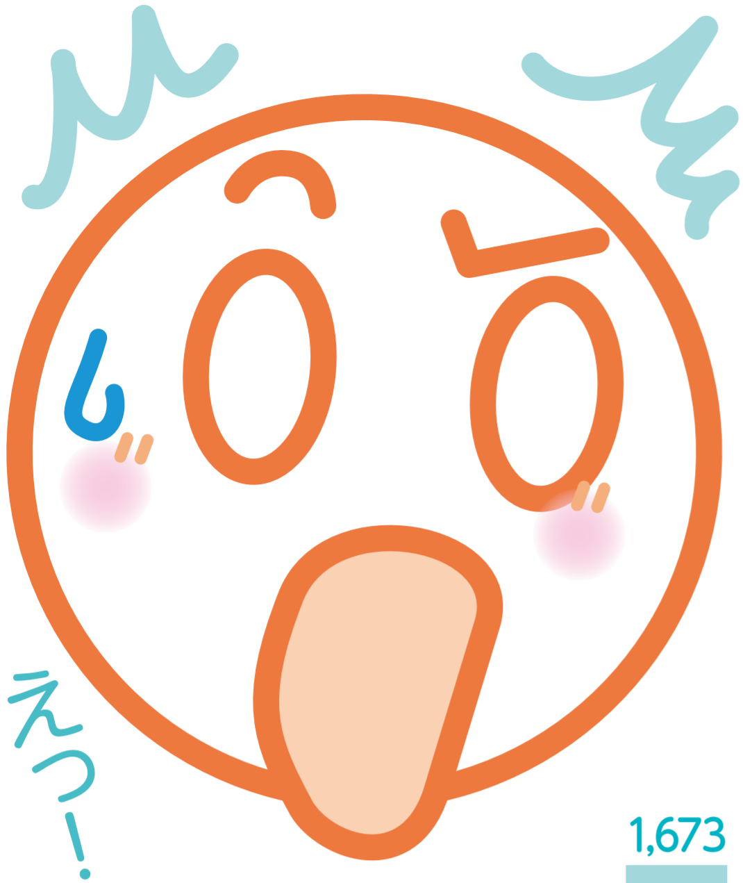
[梅毒患者報告数の推移(東京都)]

2021年の都の梅毒患者報告数は過去最多となりました。 特に20~40歳代男性と20歳代女性の患者数が急増しています。