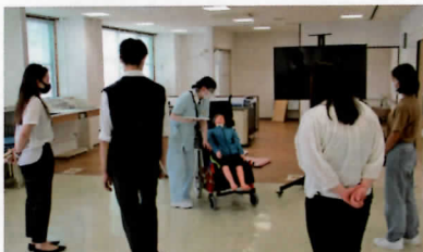
施設見学は在校生が自らの経験に基づいて説明します。看護学校での学習について具体的にイメージできます。