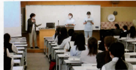
在校生が参加者からの質問に答えます。受験勉強の仕方など、参考になる意見が聞けます。