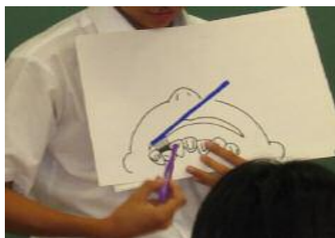
写真4 【保健委員による保健指導】