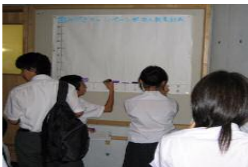
写真5 【集計をグラフに書き込みます】