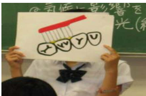
写真3 【保健委員による保健指導】