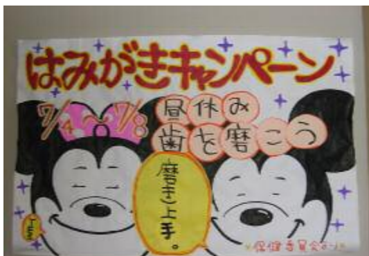
写真1 【キャンペーンポスター】