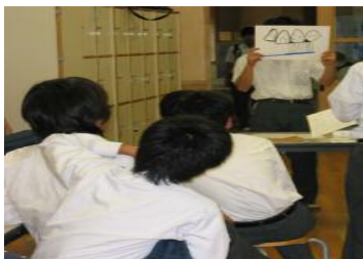
写真2 【保健委員による保健指導】