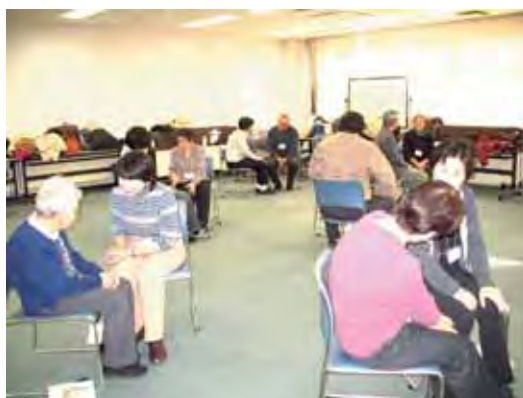
＜傾聴ボランティア養成講座の様子＞

このほか、平成18年度からの3年間で養成してきた傾聴ボランティア（120人）による在宅高齢者や施設入所者への傾聴活動支援や、認知症サポーター養成講座の開催等、地域福祉活動の担い手の確保と充実に努めています。