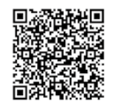
乳 児 院