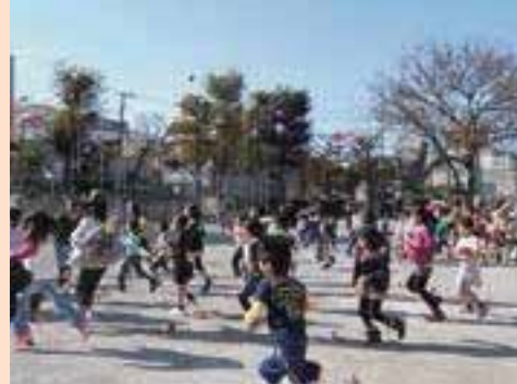
▲キッズ・プラザでのびのび集団遊び