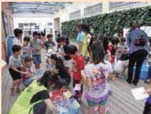
▲キッズ・プラザで縁日を実施しました

学童クラブ在籍のお子さんは、おやつや昼食を食べたり、帰りの会などの独自の活動は専用の学童クラブ室で過ごしますが、他の時間帯は校庭や体育館で自由に遊んだり、キッズ・プラザで実施する活動には一緒に参加しています。