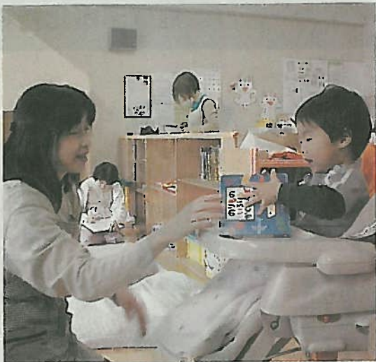
支援者養成講座を受けて3級になると、「あい・ぼーと」などで活動できる＝東京都港区

港区に続き、東京都千代田区、千葉県浦安市、札幌市でもあい・ぼーとステーションと提携し養成講座を開いている。ここから育った支援者は、児童館での一時保育、子育てサロンなどで活動している。