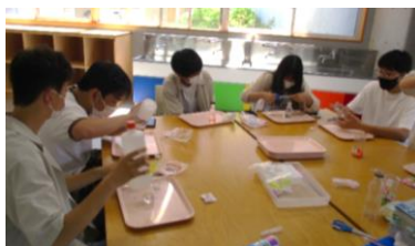
試作・検討の様子

⑤実施・振り返り…実際にやってみて感じたことや成果を、発達センター職員に伝える機会を作り、報告するとともに、コメントをもらった。