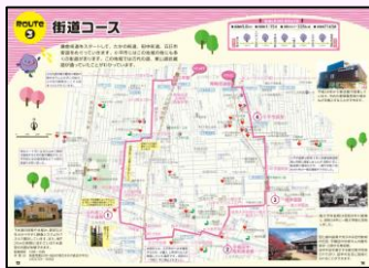
小平市ウォーキングマップ