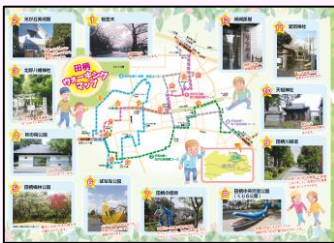
練馬区ウォーキングマップ

各区市町村などが作成した都内のウォーキングマップを集めて掲載しています。その数は…なんと 409 以上のコース数です！