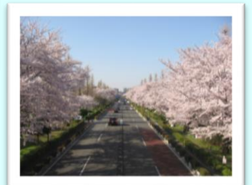
国立市 大学通りの桜