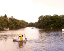
武蔵野市 井の頭恩賜公園