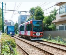
荒川区 都電荒川線沿い