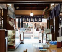
葛飾区 高木屋老舗