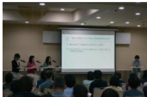
ドクターの安心トーク