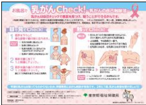
自己触診法シャワーシート