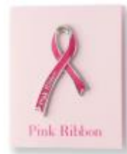
ピンクリボン オリジナルバッジ