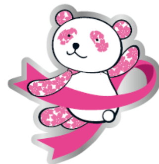
さくらパンダピンバッジ