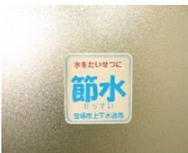
シールタイプイメージ