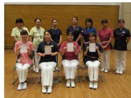
多重課題研修の体験型演習場面

今後も多重課題への対応や短期利用者の受持ちなど新たに学ぶこともありますが、新人看護師のみなさん笑顔で一歩ずつ前に進んでいきましょう。センター職員みなで見守り、支援していきます！