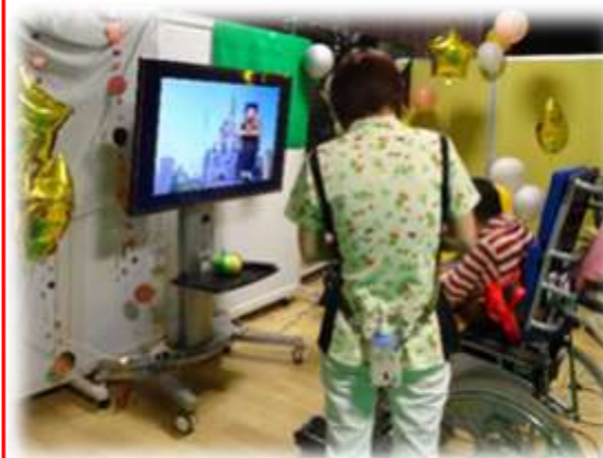
感覚刺激コーナーで まほうの世界を体験