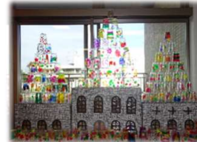
全体制作 ~まほうが使えたら~