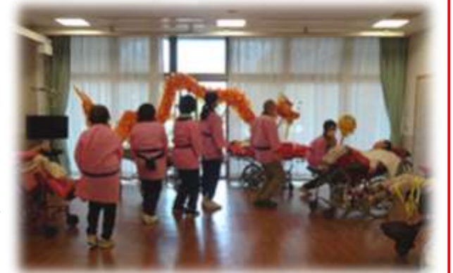
～オープニングセレモニー～ 舞龍が病棟を訪問しました

お祭りは院長の館内放送による「開会のあいさつ」で始まりました。病棟にはまず「舞龍」が訪問。金色の宝珠を求めて舞い踊る龍を表す、縁起の良いオープニングセレモニーを行いました。そしてイベント会場には、通所と通園そして新センターになって初めて外来の利用者さんをお迎えしました。外来の方には、当日受診のある利用者さんに1階会場のみをご案内する形でしたが、複数組の方が参加され、お祭りを一緒にお楽しみいただくことができました。