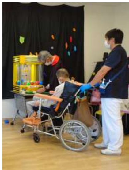
ゲームコーナーで百味クレーンゲームに挑戦

他にも、職員による「摂食嚥下ワーキンググループ」の『摂食嚥下回診って、どんなことをしているの?』や、「緩和ケア委員会」の『もしばなゲームを通して、自分らしい生き方を考えてみませんか?』、「認定看護師会」の『ラッタッタ体操で呼吸筋をほぐしてリラックス!!!』といった企画ブースもあり、盛りだくさんのイベント会場となりました。