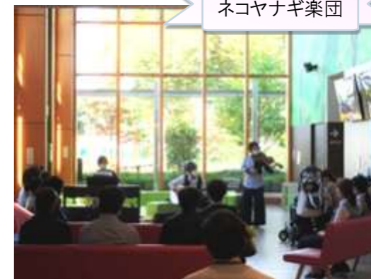
外来でのミニコンサート