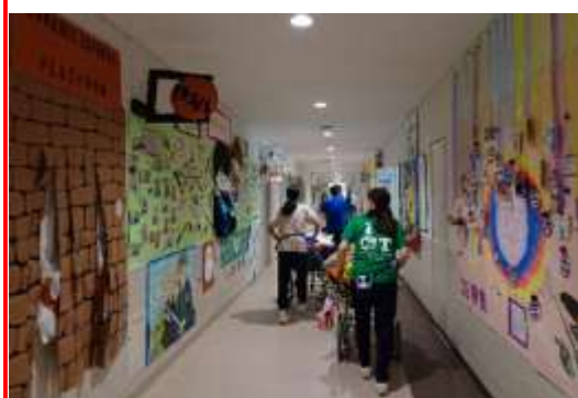
展示作品を楽しんでいます

外部出店コーナーは、今年も地域の障害者施設等の皆さまに、それぞれ自慢の商品を販売していただきました。昨年度に引き続き「食彩さしすせそ」さん、「ワークセンターこむたん」さん、「ギャロップ」さん、「武蔵台学園」さん、そして久しぶりに「府中刑務所」さんが参加してくださいました。昨年度まではお店ごとに部屋が分かれていましたが、今回一堂に会していただくと、それぞれ机いっぱい商品が並べられ、一時は車いすの向きを変えるのにも気を使うほどの大賑わいとなりました。