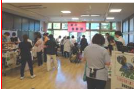
外部出店コーナーは大賑わい

外部出店コーナーは、今年も地域の障害者施設等の皆さまに、それぞれ自慢の商品を販売していただきました。昨年度に引き続き「食彩さしすせそ」さん、「ワークセンターこむたん」さん、「ギャロップ」さん、「武蔵台学園」さん、そして久しぶりに「府中刑務所」さんが参加してくださいました。昨年度まではお店ごとに部屋が分かれていましたが、今回一堂に会していただくと、それぞれ机いっぱい商品が並べられ、一時は車いすの向きを変えるのにも気を使うほどの大賑わいとなりました。